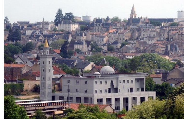
Rue de la Vincenderie, le chantier tourne aujourd'hui au ralenti.

Faute d'argent, la construction de la mosquée est aujourd'hui au point mort. Elle n'ouvrirait que dans un an.